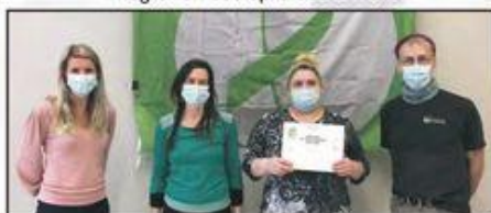
Santé, assistance et soins infirmiers 2 e année