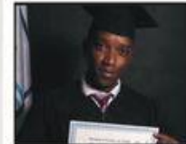
Borges Billygraham Beauge Bourse de la Fondation santé de La Haute-Gaspésie Santé, assistance et soins infirmiers