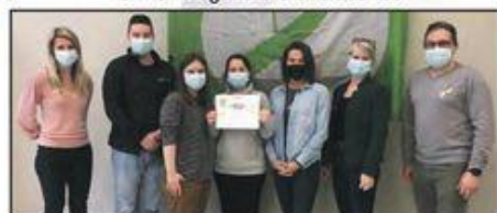
Santé, assistance et soins infirmiers 1 re année